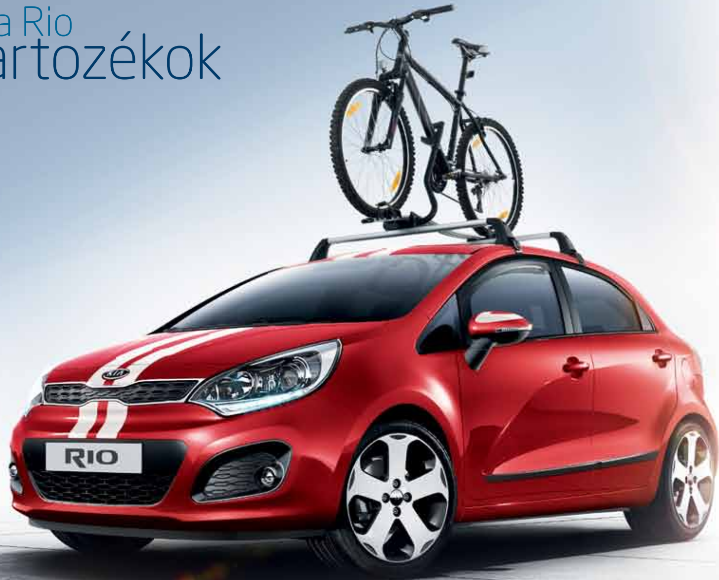
Alumínium keresztartó áramvonalas design, a RIO-hoz fejlesztve