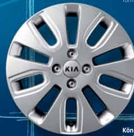
Könnyűfém keréktárcsa Erőtéljes, szellős vonalú