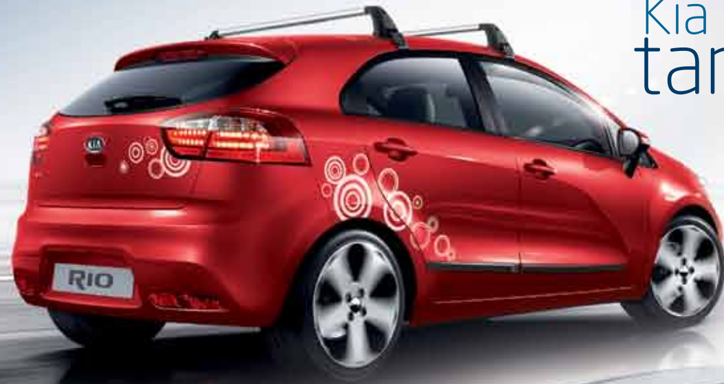
Body decals "Alternative"