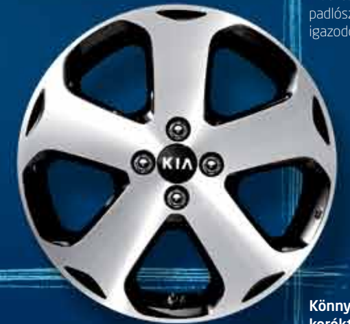
Könnyűfém keréktárcsa Klasszikusan sportos