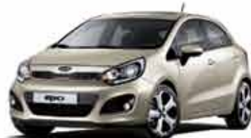
FDP Fresh Beige