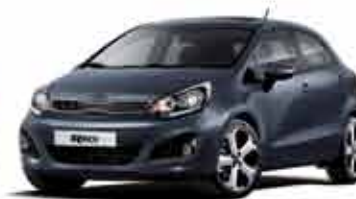
BLA Deep Blue