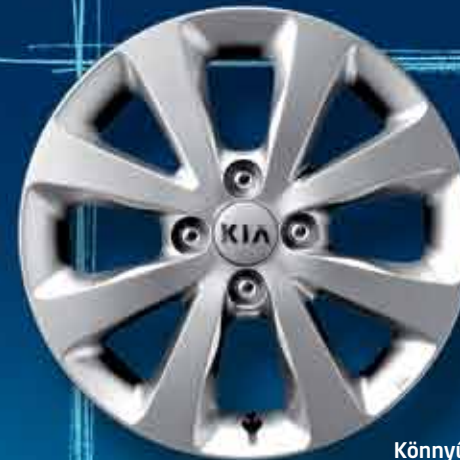
Könnyűfém keréktárcsa Modern és egyedi formavilágú