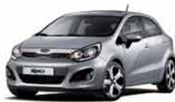
3D Bright Silver