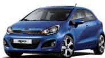
FDB Electronic Blue