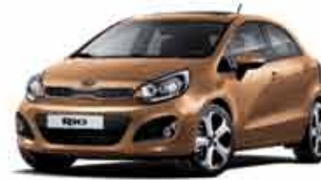
F2G Caramel Yellow