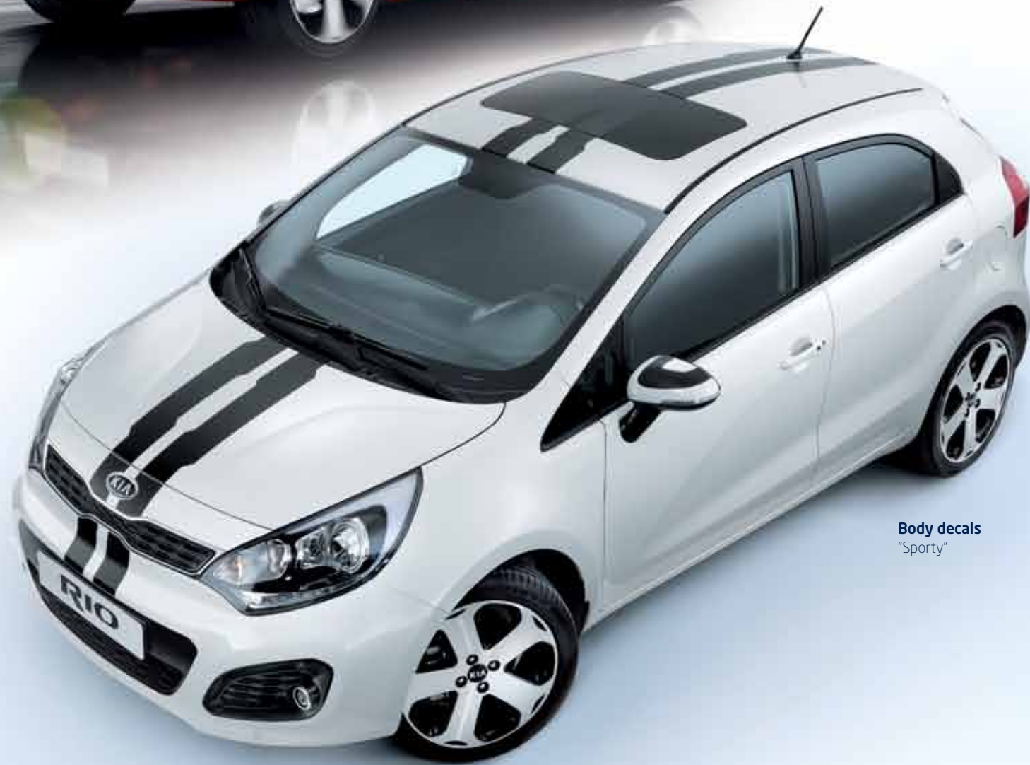
Body decals "Sporty"