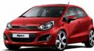
BEG Signal Red